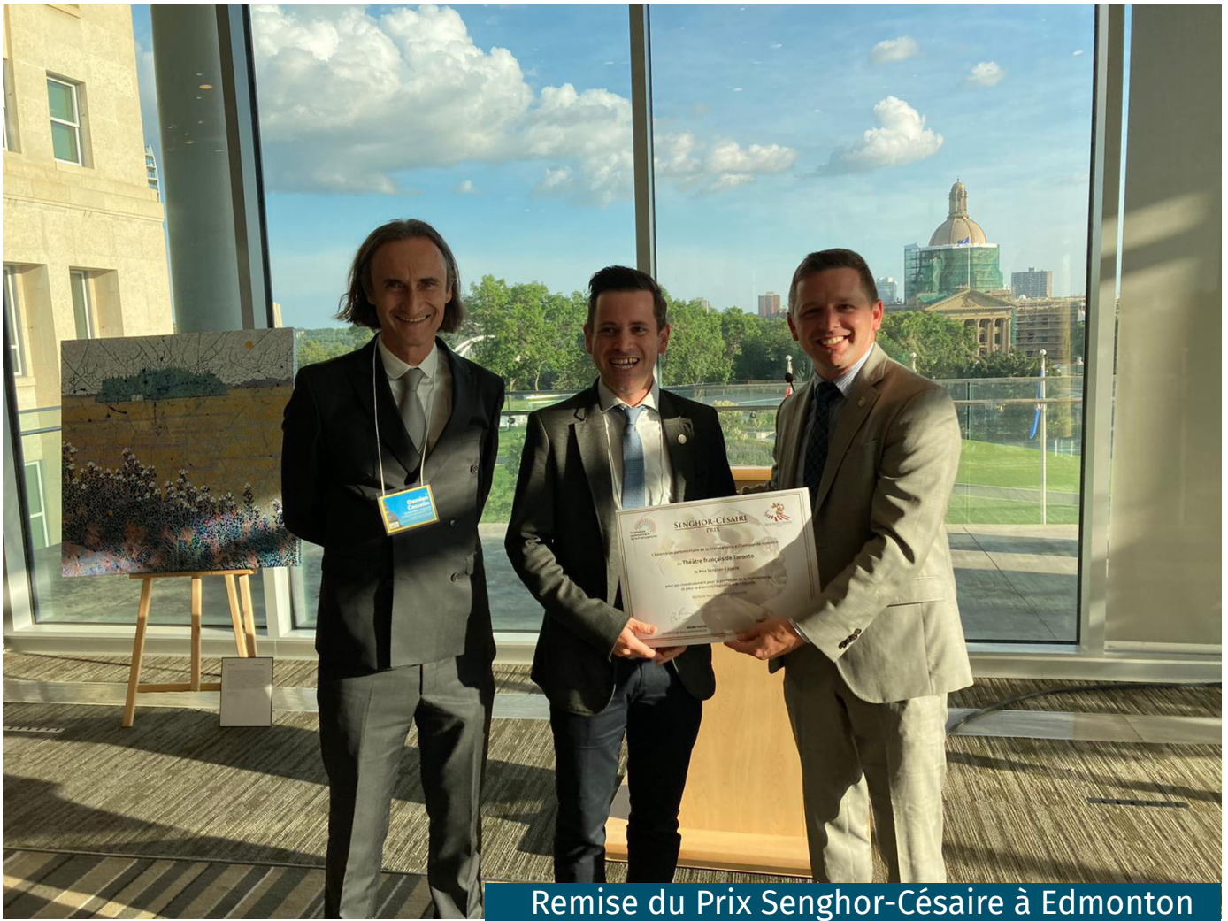
Remise du Prix Senghor-Césaire à Edmonton