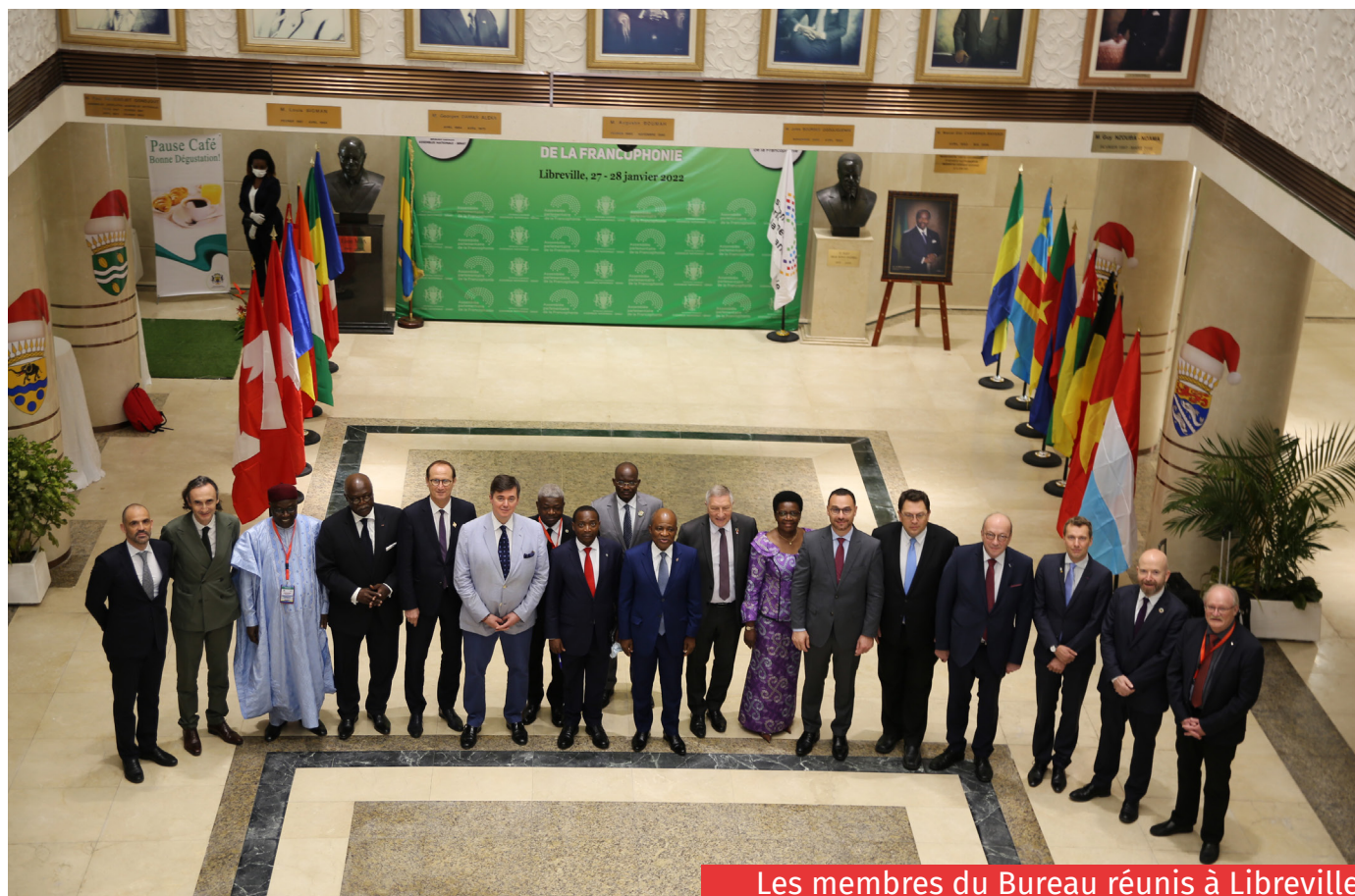
Les membres du Bureau réunis à Libreville

L'adoption d'un calendrier raisonnable pour la tenue d'élections libres au Mali a aussi été exigée.