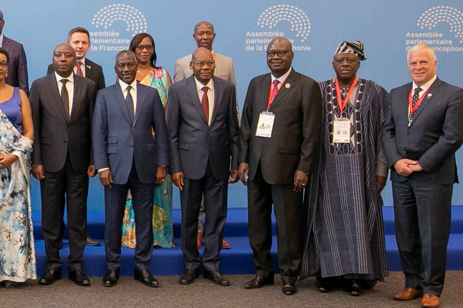
Le Président de l'Assemblée parlementaire de la Francophonie, le SGP, le Président de l'APF, Adama Bictogo, et le Premier ministre du Rwanda, Edouard Ngirente