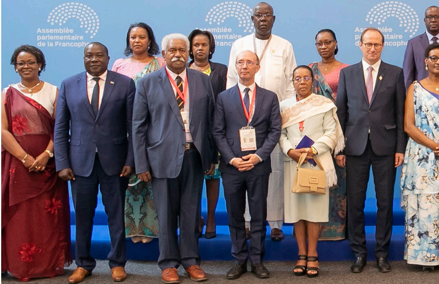
Les présidents de Char