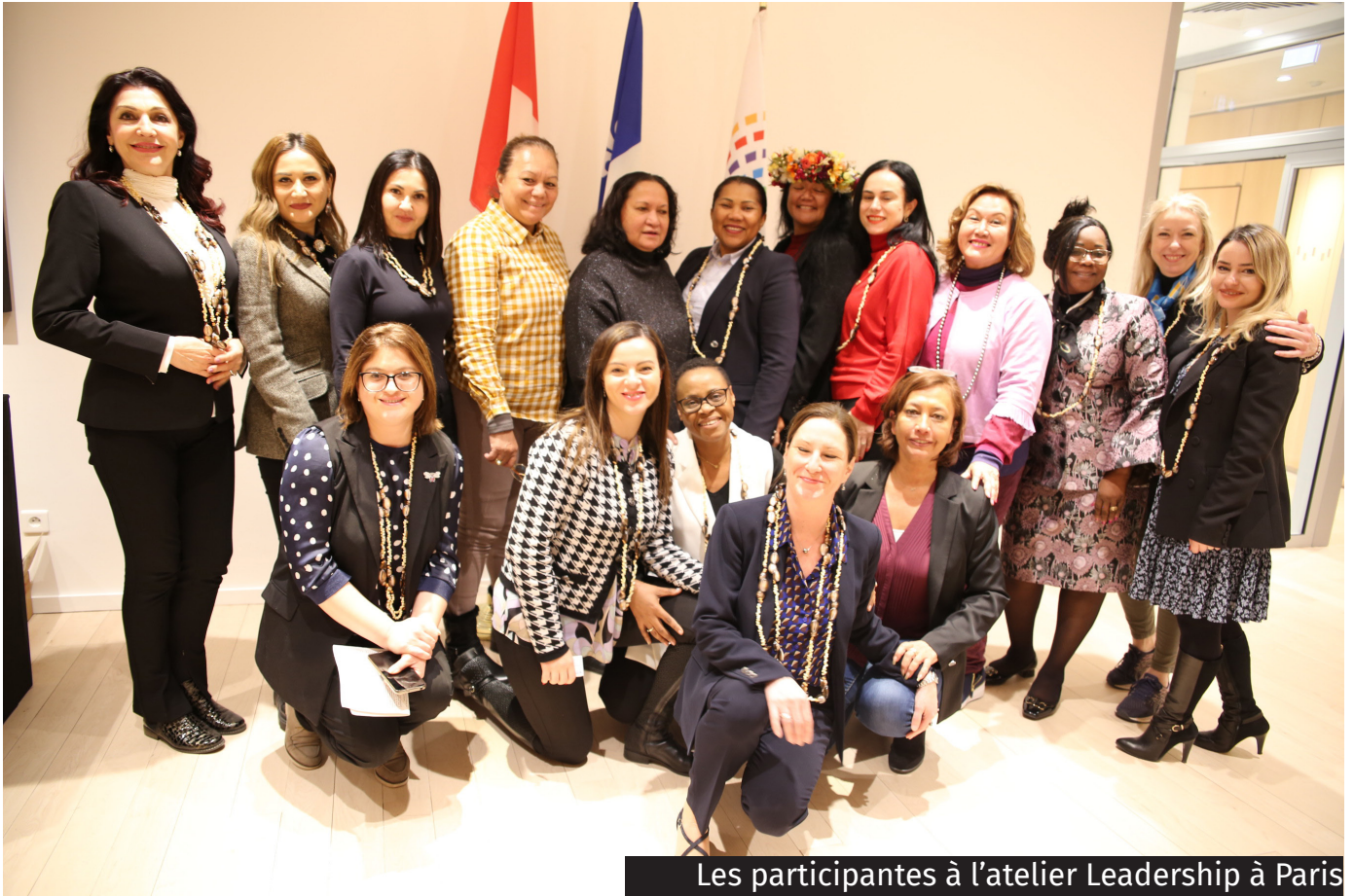
Les participantes à l'atelier Leadership à Paris