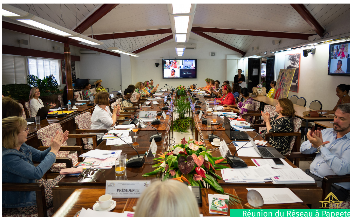
Réunion du Réseau à Papeete

Réuni à Kigali, en marge de la 47 e Session de l'APF, le Réseau a examiné plusieurs projets de résolutions notamment sur la mise en place d'une politique pour lutter contre les violences faites aux femmes dans les Parlements, sur la promotion de l'autonomisation économique des femmes dans l'espace francophone ; un projet de rapport sur la