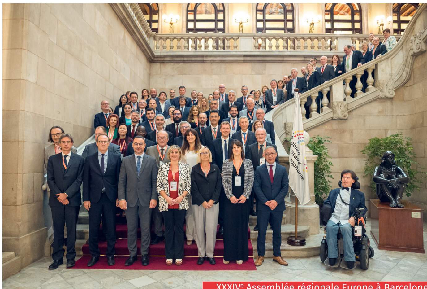
XXXIV e Assemblée régionale Europe à Barcelone