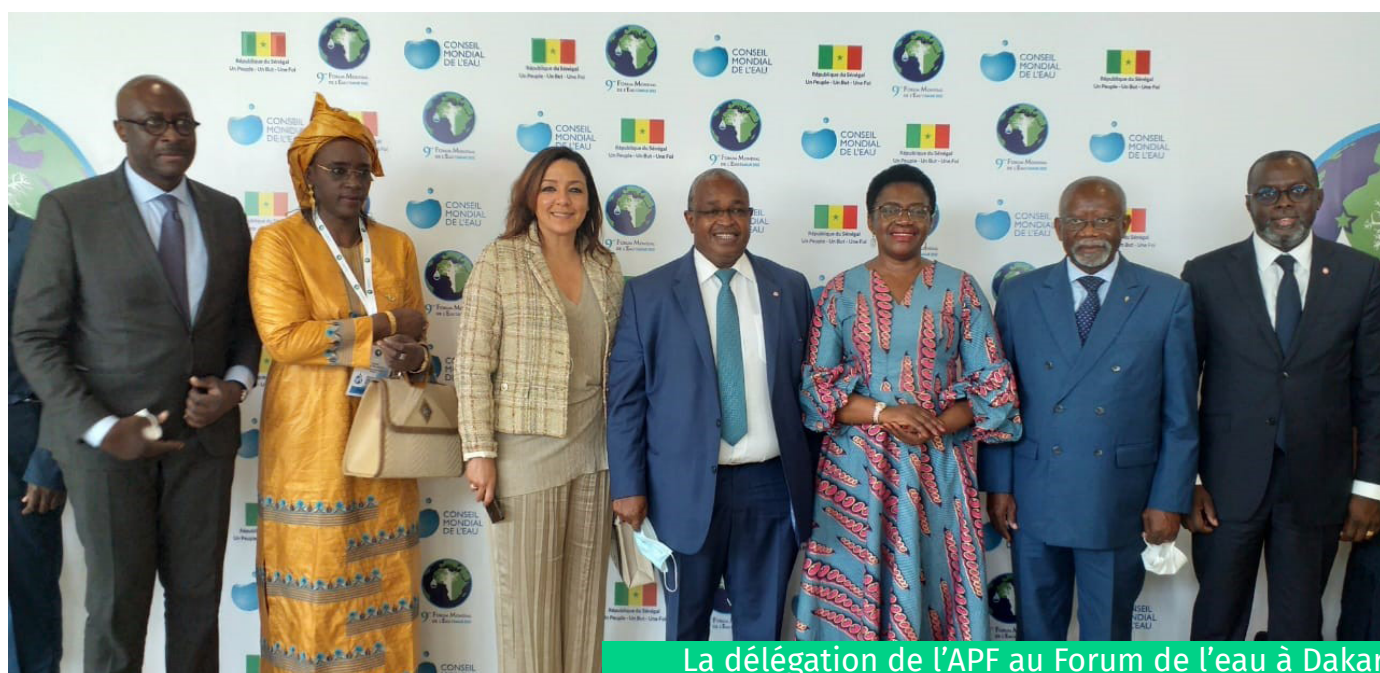
La délégation de l'APF au Forum de l'eau à Dakar

Organisé pour la première fois en Afrique de l'Ouest, quelques mois avant la CdP27, ce Forum a marqué une mobilisation sans précédent des parlementaires francophones dans la lutte pour la réduction des inégalités d'accès à l'eau potable et à l'assainissement.