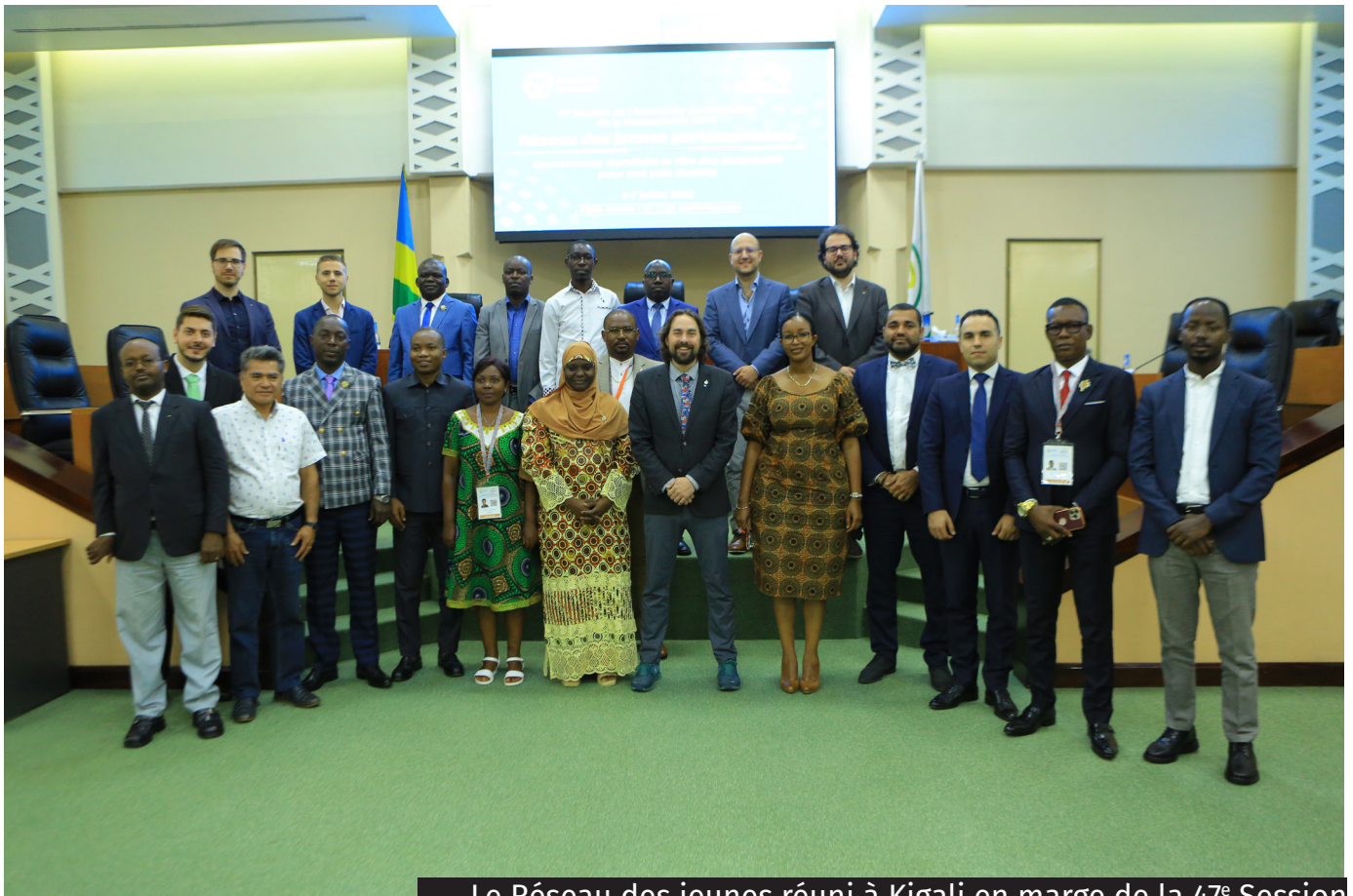
Le Réseau des jeunes réuni à Kigali en marge de la 47 e Session