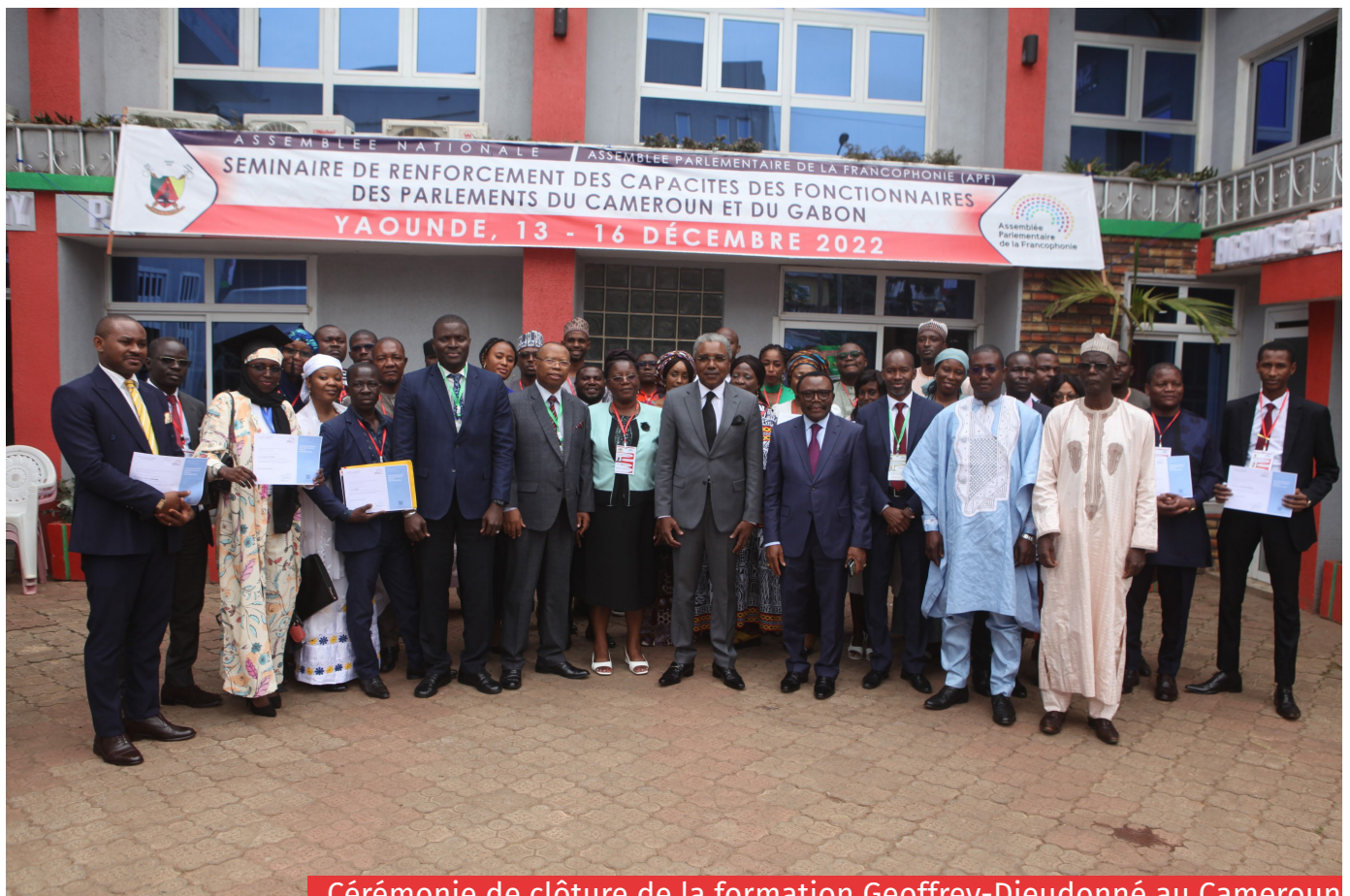
Cérémonie de clôture de la formation Geoffrey-Dieudonné au Cameroun