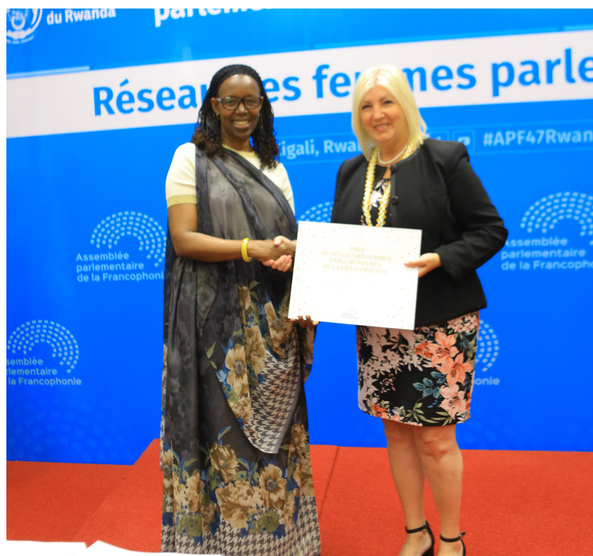
Remise du premier Prix du Réseau des femmes parlementaires

Une piste de collaboration a été lancée, notamment pour l'organisation de séminaires parlementaires du Réseau des femmes sur cette question au bénéfice des sections membres de l'APF.