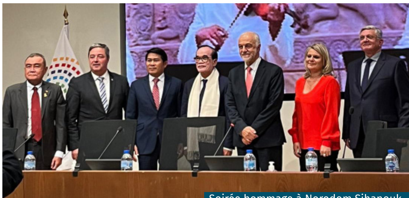
Soirée hommage à Norodom Sihanouk