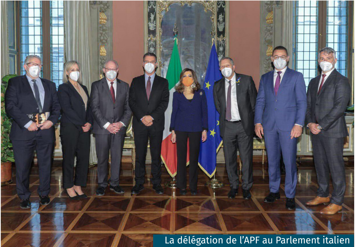
La délégation de l'APF au Parlement italien