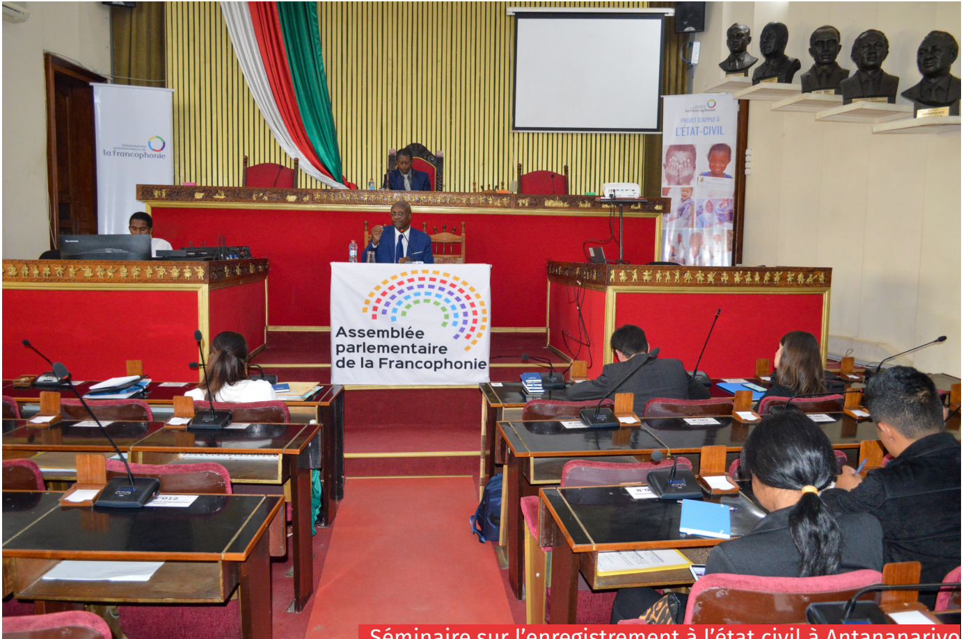
Séminaire sur l'enregistrement à l'état civil à Antananarivo