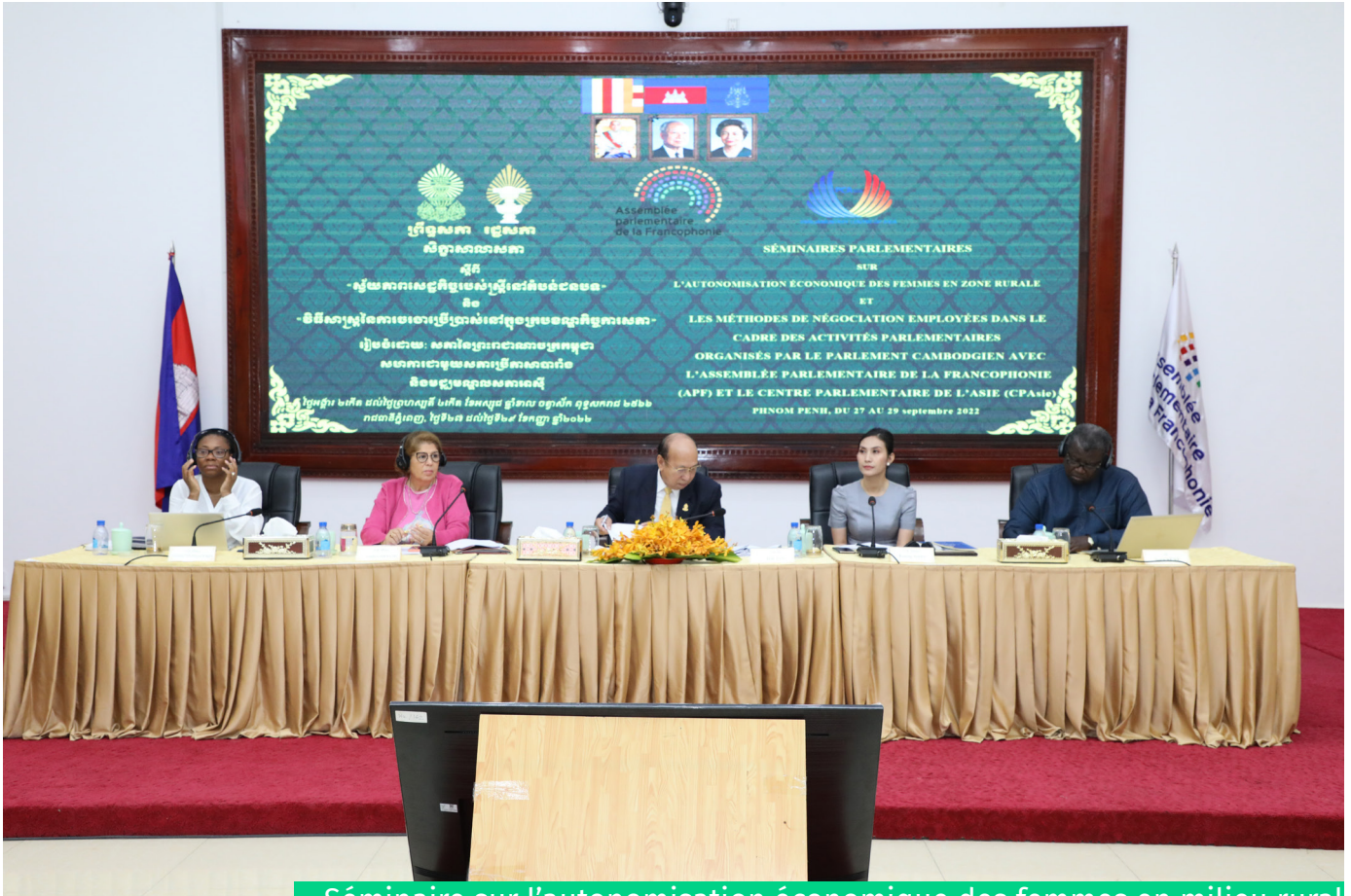
Séminaire sur l'autonomisation économique des femmes en milieu rural