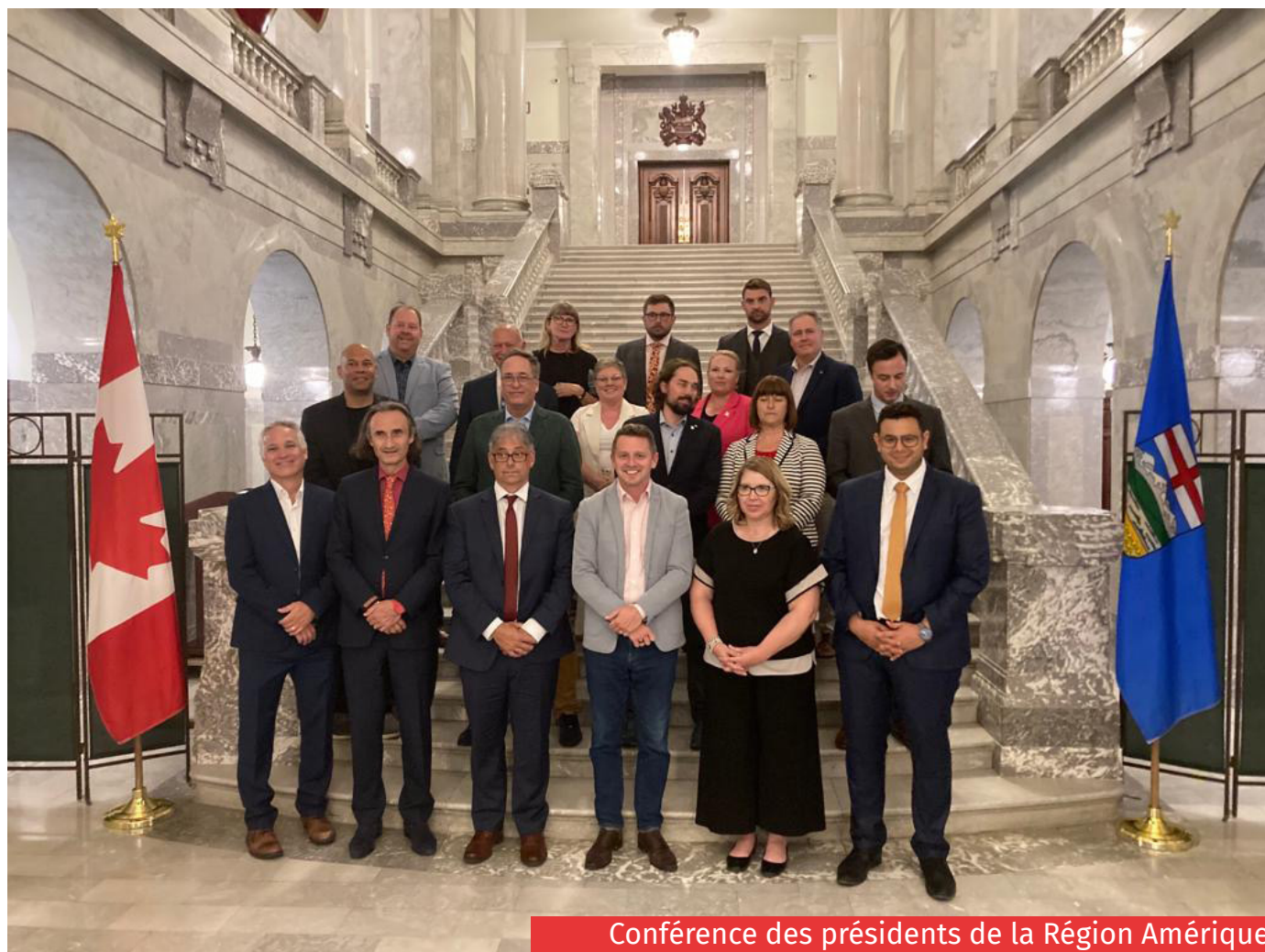
Conférence des présidents de la Région Amérique