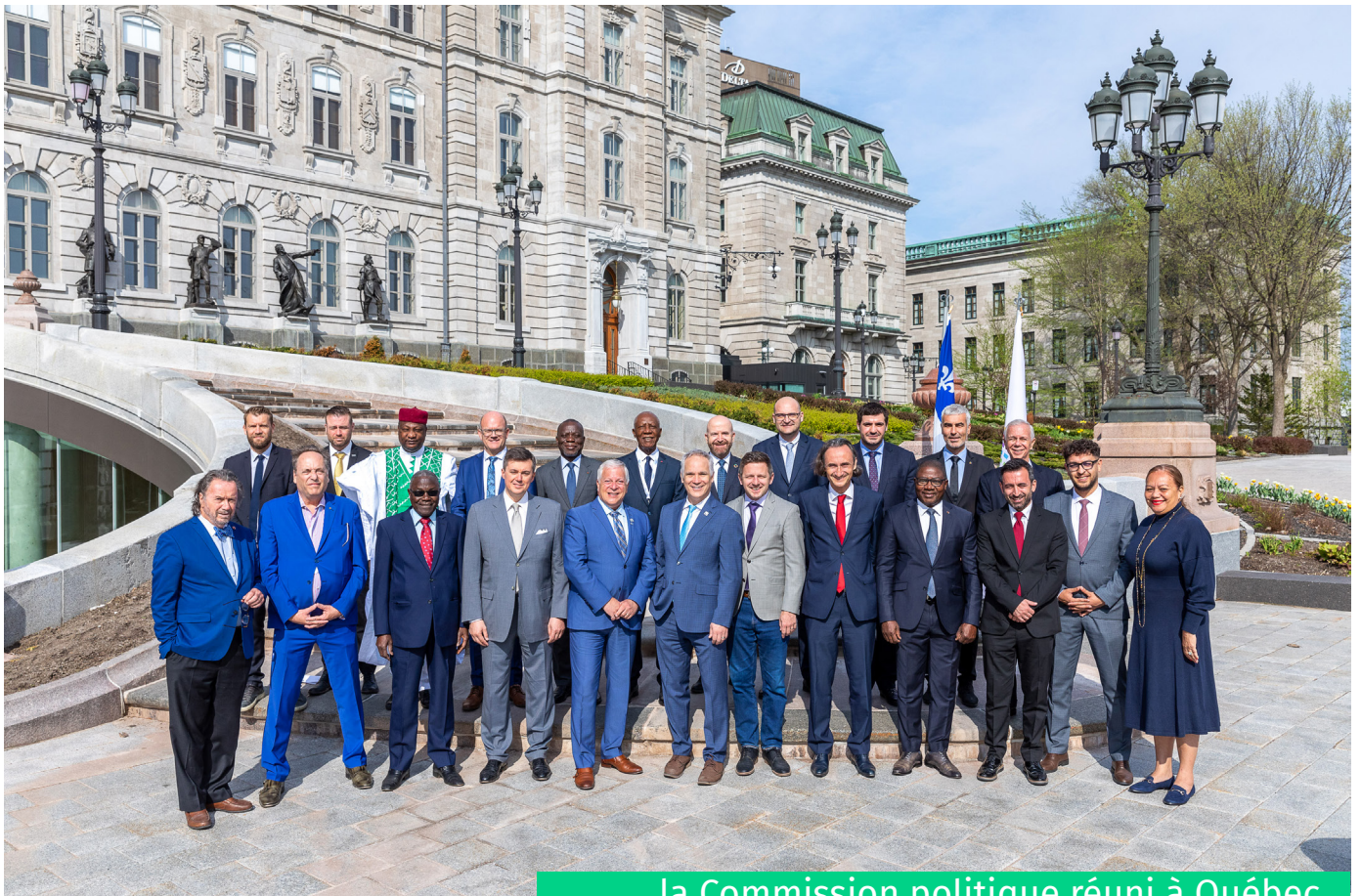
la Commission politique réuni à Québec

Lors de sa réunion organisée en marge de la 47 e Session de l'APF, à Kigali, la Commission politique a discuté de l'état d'avancement des travaux du Groupe de travail sur la modernisation des Statuts de l'APF et a pris connaissance de l'intérêt du parlement de l'Ukraine à devenir membre de l'APF.