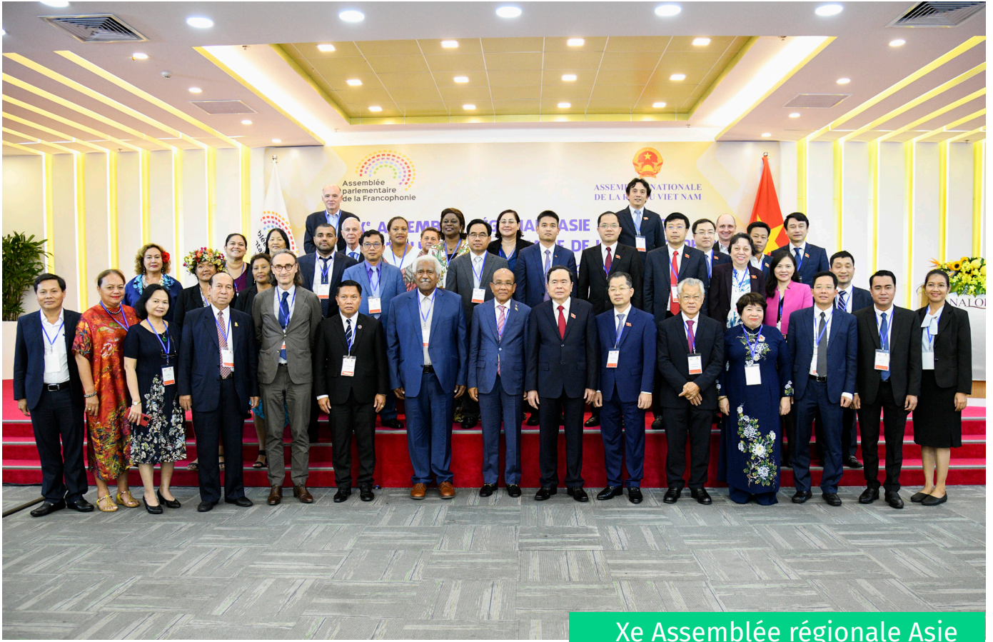
Xe Assemblée régionale Asie