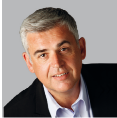
PASCAL TERRASSE Député français Secrétaire général parlementaire de l'Assemblée parlementaire de la Francophonie

Le second semestre 2016 a été marqué par la 42e Session de l'APF et le XVIe Sommet de la Francophonie tenus tous deux, dans les mêmes lieux, à Antananarivo.