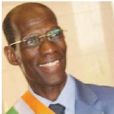
BASSY KOFFI Léonard Bernard

Sénateur à la Chambre du Senat de Côte d'Ivoire