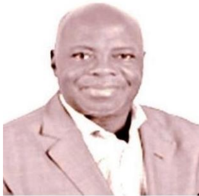
BONI Kouamé Séraphin

Sénateur à la Chambre du Senat de Côte d'Ivoire