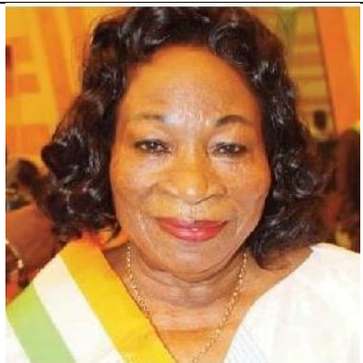
ADJOUA N'Go Louise épouse TAMINI

Sénateur à la Chambre du Senat de Côte d'Ivoire